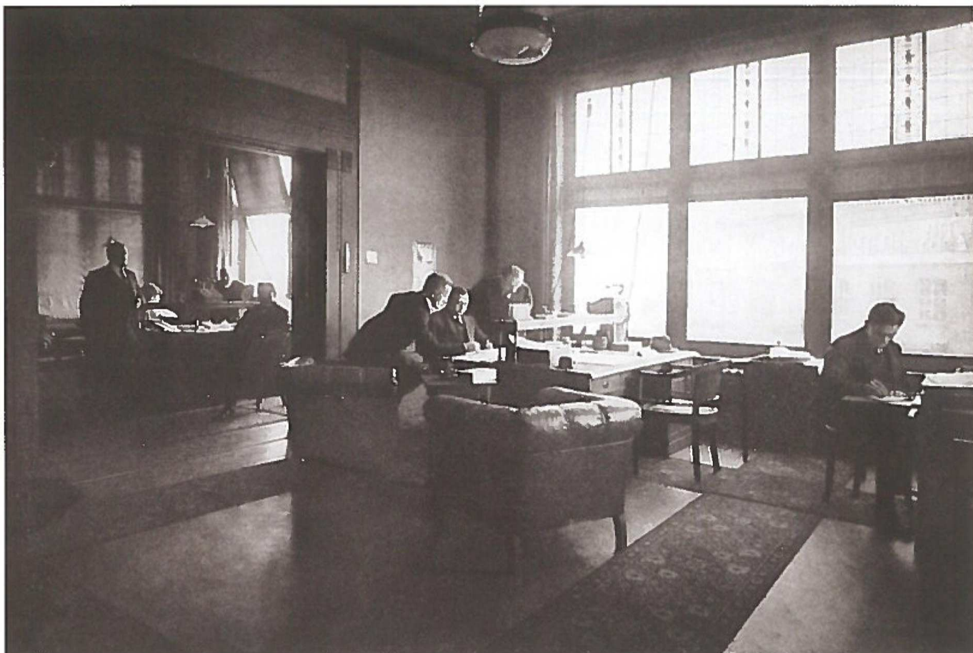
Het kantoor van de Lobithse Scheepsbouw Maatschappij in 1921.