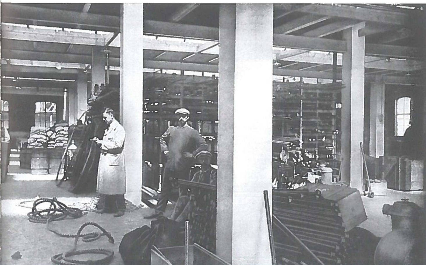
Een kijkje in het magazijn van de Lobithse Scheepsbouw Maatschappij v/h Gebrs. Bodewes in 1921. In 1925 gaat deze werf failliet; scheepswerf De Hoop in Pannerden neemt de werf met alle gebouwen en machines in 1929 over.